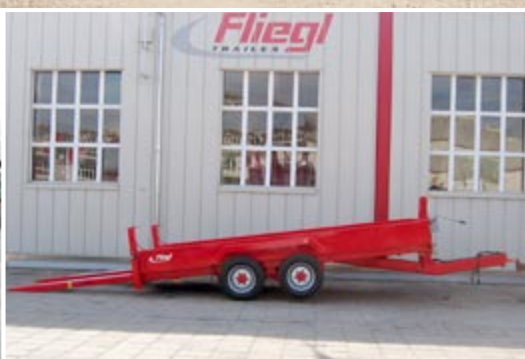
Наклоняемая погрузочная поверхность для техники с низким дорожным просветом.