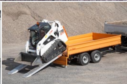
Многообразно применим для высоких загрузок.

Тандем трёхсторонние самосвалы от Флигл общим весом от 6,0 до 18,0 тонн содержатся в стандартной программе. Оснащенный безупречными деталями и выразительно прочно собранный представляет собой данный самосвал неистощимого сопровождающего.