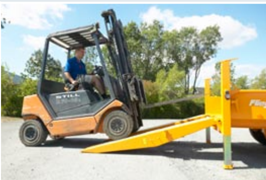
Оцинкованные, телескопируемые опорные ноги.