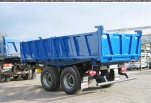
Тандем трёхсторонний самосвал 18,0 т.