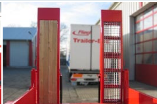
Производятся раппы на выбор как с деревянным покрытием так и с решётчатым с возможностью установления третьей раппы.