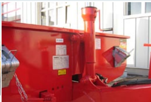
Регулируемое по высоте дышло.