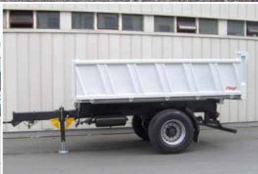
Одноосный трёхсторонний самосвал 9,5 т.