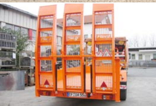
Заездные раппы в решётчатом исполнении для заезда например трехколесных машин.