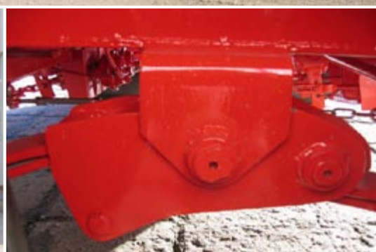
Не требующий обслуживания tandemный рессорный агрегат с износостойкими буксами.